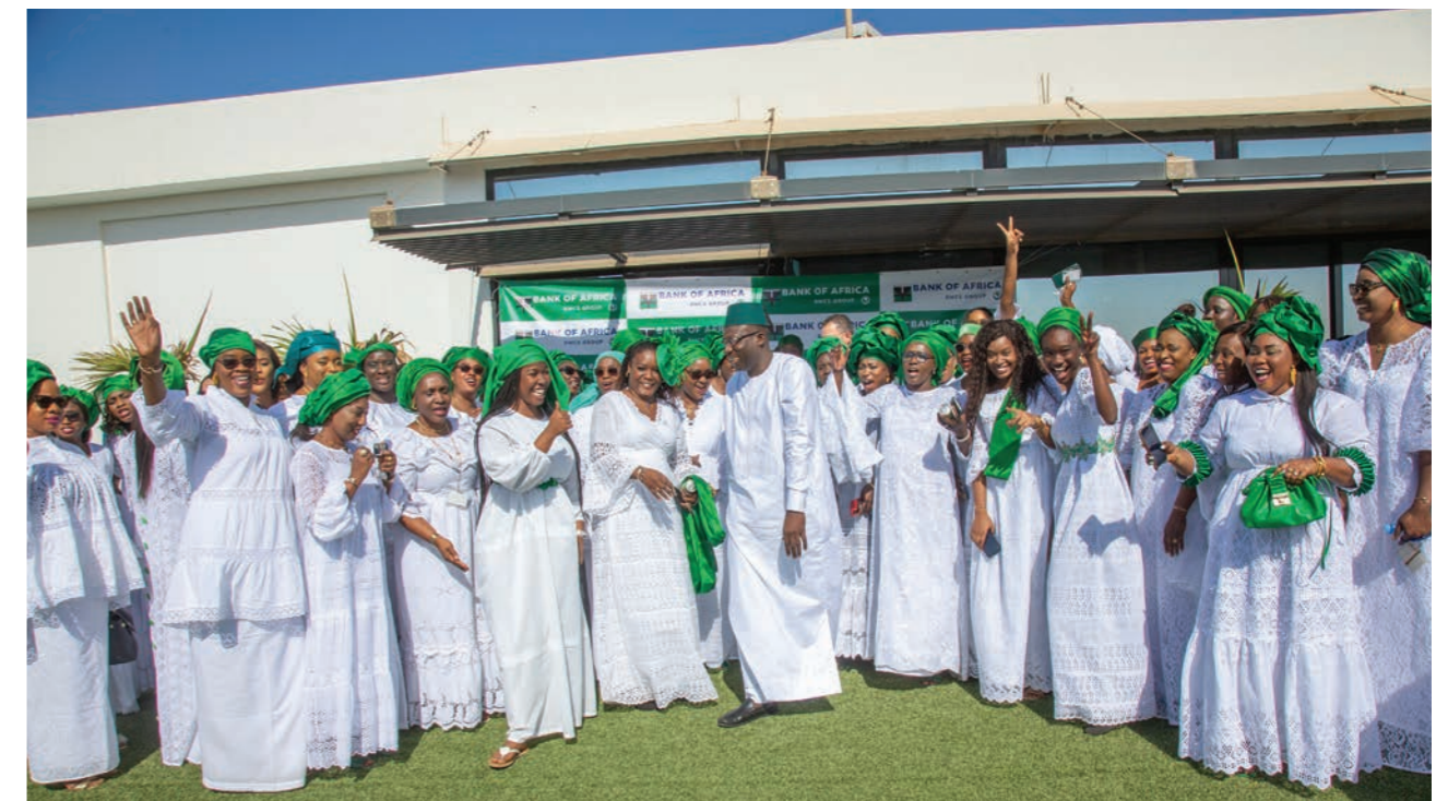
Célébration de la Journée Internationale des Droits des Femmes