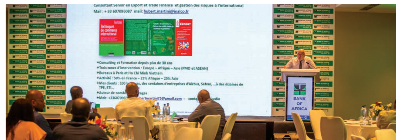
Conférence avec les clients BOA