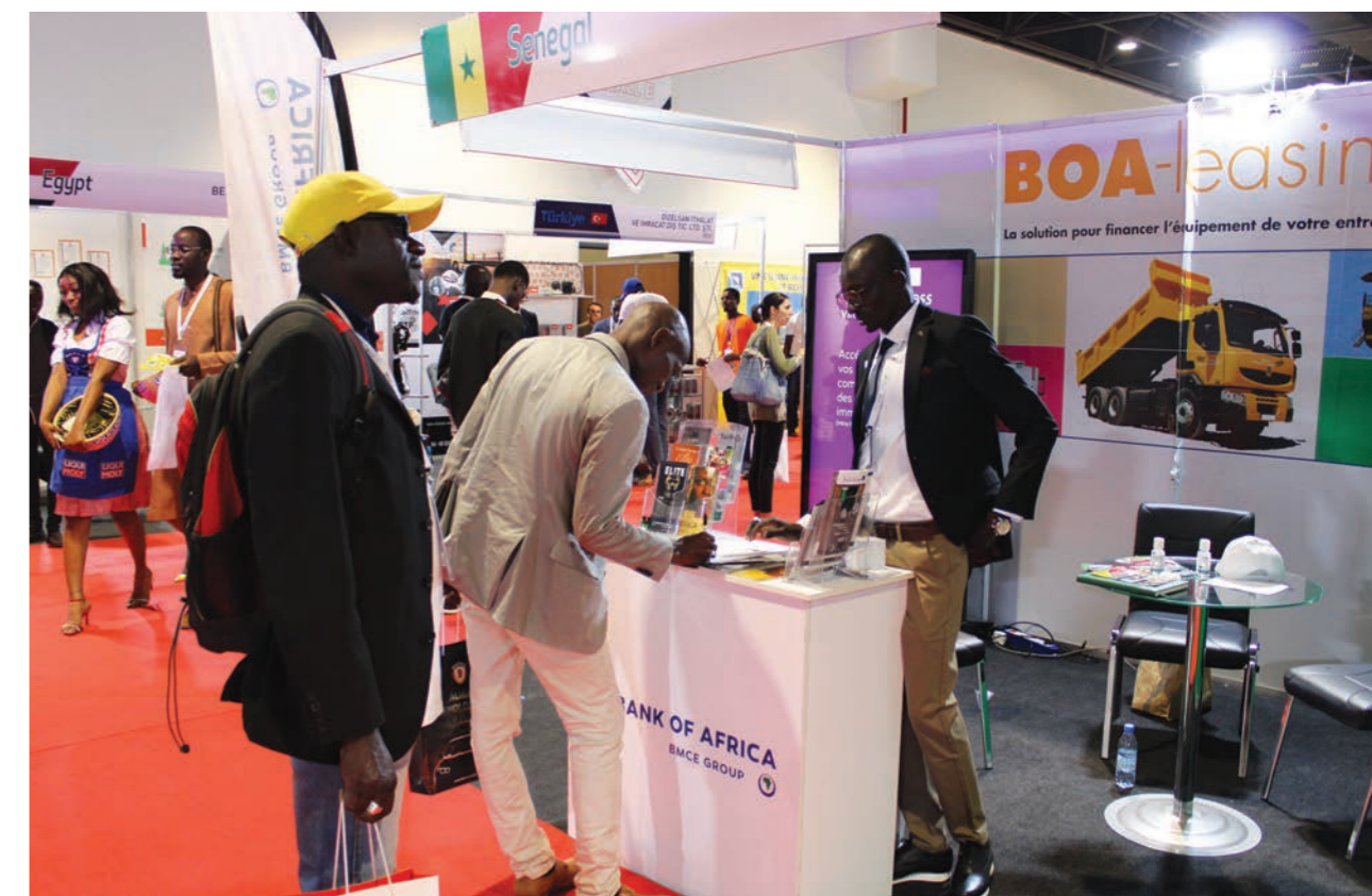
Stand BOA au salon d'exposition Hage Afrique